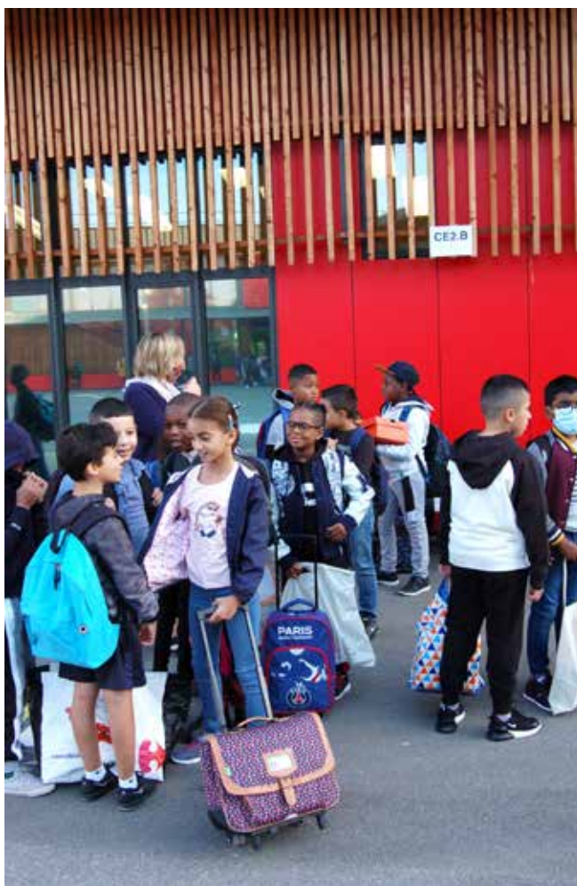
1419 élèves fréquentent les écoles de Fleury. Un chiffre en constante augmentation.

Au carrefour de plusieurs quartiers, La Greffière, les Aunettes et les Joncs-Marins, le terrain de 9000 m 2 occupe une position centrale. C'est sur cet emplacement que sera construit un bâtiment de 4400 m 2 susceptible d'accueillir 17 classes, un centre de loisirs et une cuisine centrale. Il sera exemplaire au point de vue envi-