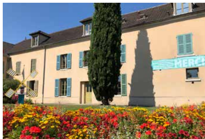
L'équipe de la mairie de Fleury-Mérogis multiplie les réunions publiques pour inciter au débat, à l'échange constructif et stimuler le lien social.

Enfin, la Ville souhaite accompagner la jeunesse dans cette période si délicate. Réorganisation des services, aides au BAFA, réouverture du Point Information Jeunesse, partenariats avec Les Pionniers de France... En 2021, plus que jamais, les jeunes auront besoin d'être épaulés par la municipalité et soutenus par la solidarité de tous et toutes. ■