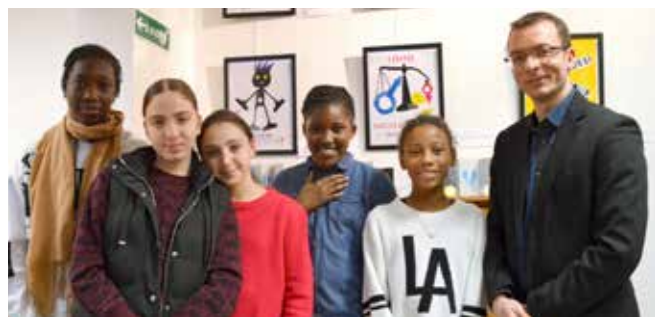
Le Maire et des jeunes (photo avant le Covid-19).