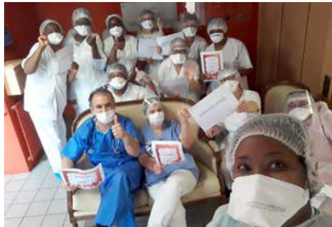
Aucun nouveau cas après l'été. L'équipe de l'Ehpad Marcel Paul est fière d'avoir endigué la deuxième vague.

« Nous sommes pour ainsi dire devenu une micro-société fonctionnant en vase-clos, raconte-t-elle. Pendant des mois nous n'avions presque aucun contact avec l'extérieur. C'était parfois compliqué, en particulier vis-à-vis des familles. Mais c'était nécessaire car nous voulions avant tout