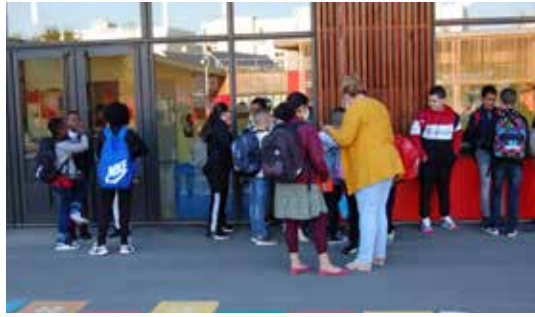
ici à Robert-Desnos...