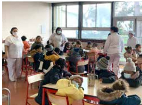
Tout au long de l'année 2020, les agents de la Ville et les différents services municipaux se sont mobilisés pour maintenir un service public de proximité.

avec des animations et des sorties. Une salle, équipée de matériel informatique, a également été mise à disposition des étudiants