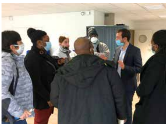
Le maire s'entretient avec les habitants.

Nouvelle pratique démocratique, collège, nouvelle école, création de jardins partagés, réouverture du