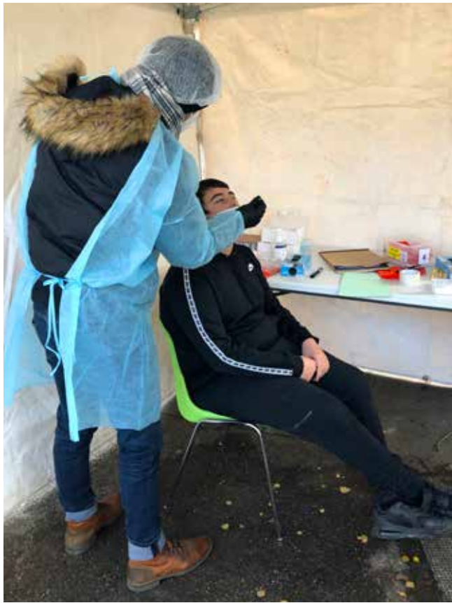
Deuxième journée de dépistage en décembre avec le soutien de la Région, l'Agence régionale de la santé (ARS) et la Croix-Rouge.