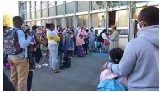
et dans le groupe Paul-Langevin.