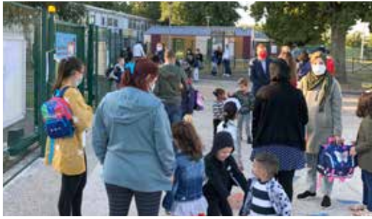
Du côté du groupe scolaire Joliot-Curie...