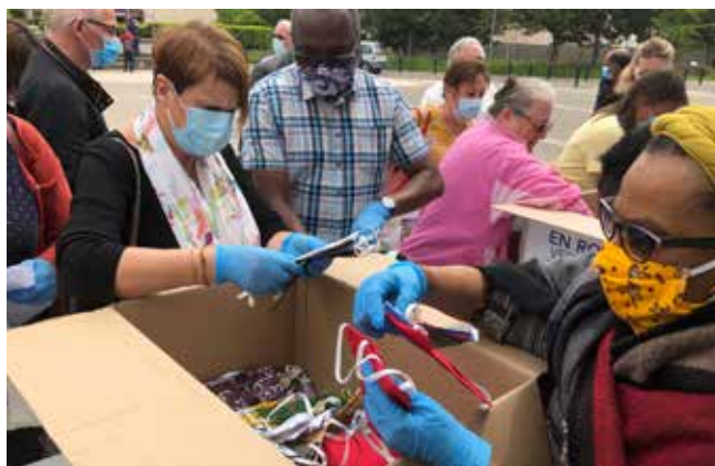
6 831 masques ont été distribués aux habitants par les élus et les bénévoles.

et à l'initiative de ce projet. Pour couvrir les besoins, il fallait en réaliser environ 700. Mais grâce à un élan de générosité, ce sont finalement près de 1 500 qui ont été fabriqués en une semaine, permettant ainsi d'en distribuer deux à chaque personne.